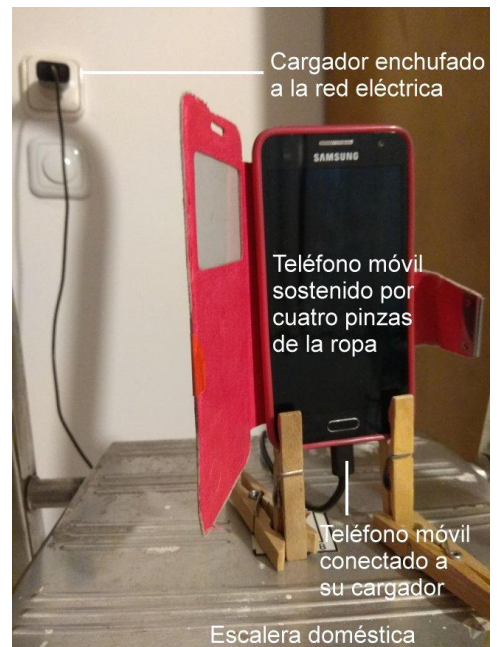
Detalle de cómo se puede aguantar un teléfono móvil conectado a su cargador sobre una superficie plana, mediante cuatro pinzas para la ropa.