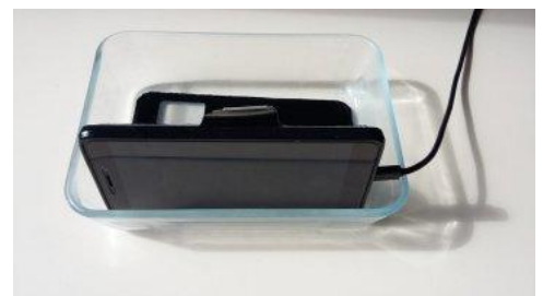
Teléfono móvil conectado a su cargador, sostenido mediante una bandeja de vidrio para cocinar.