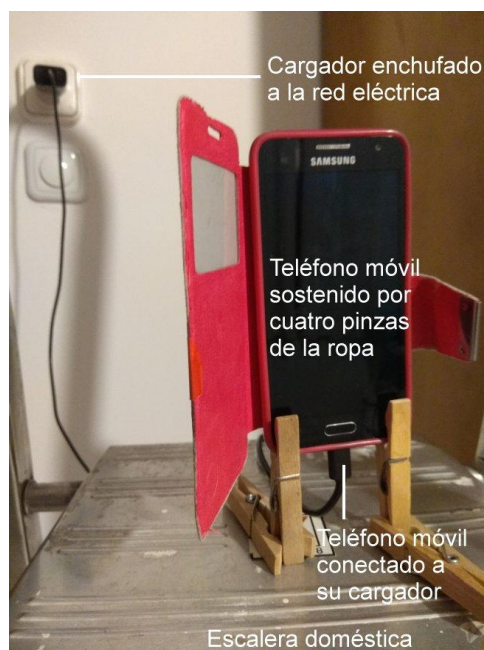
Detall de com es pot aguantar un telèfon mòbil connectat al seu carregador, sobre una superfície plana, mitjançant quatre pinces per a la roba.