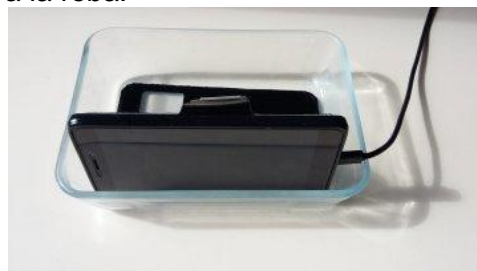
Telèfon mòbil connectat al seu carregador, sostingut mitjançant una safata de vidre per cuinar.