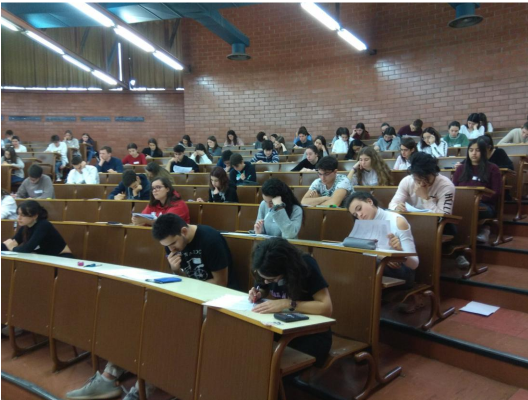
Aspecte d'una aula de la Facultat de Biologia de la Universitat de Barcelona el dissabte 8 de febrer durant la prova teòrica.