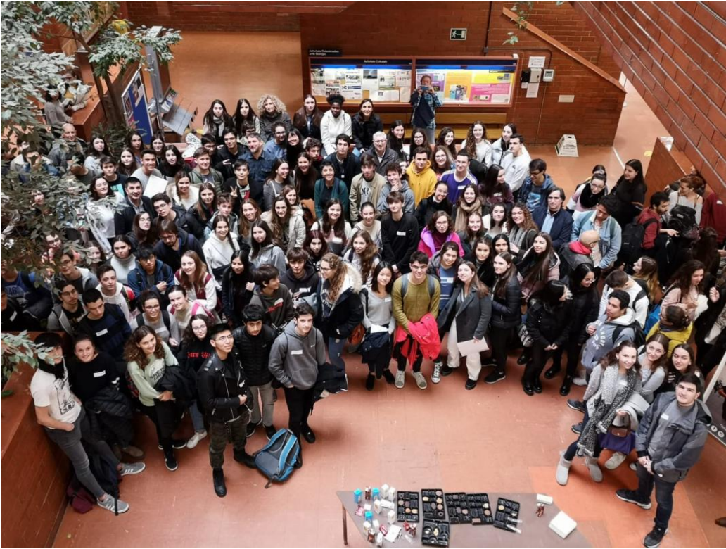
El participants en la prova teòrica a la Facultat de Biologia de la Universitat Barcelona, el dissabte 8 de febrer de 2020